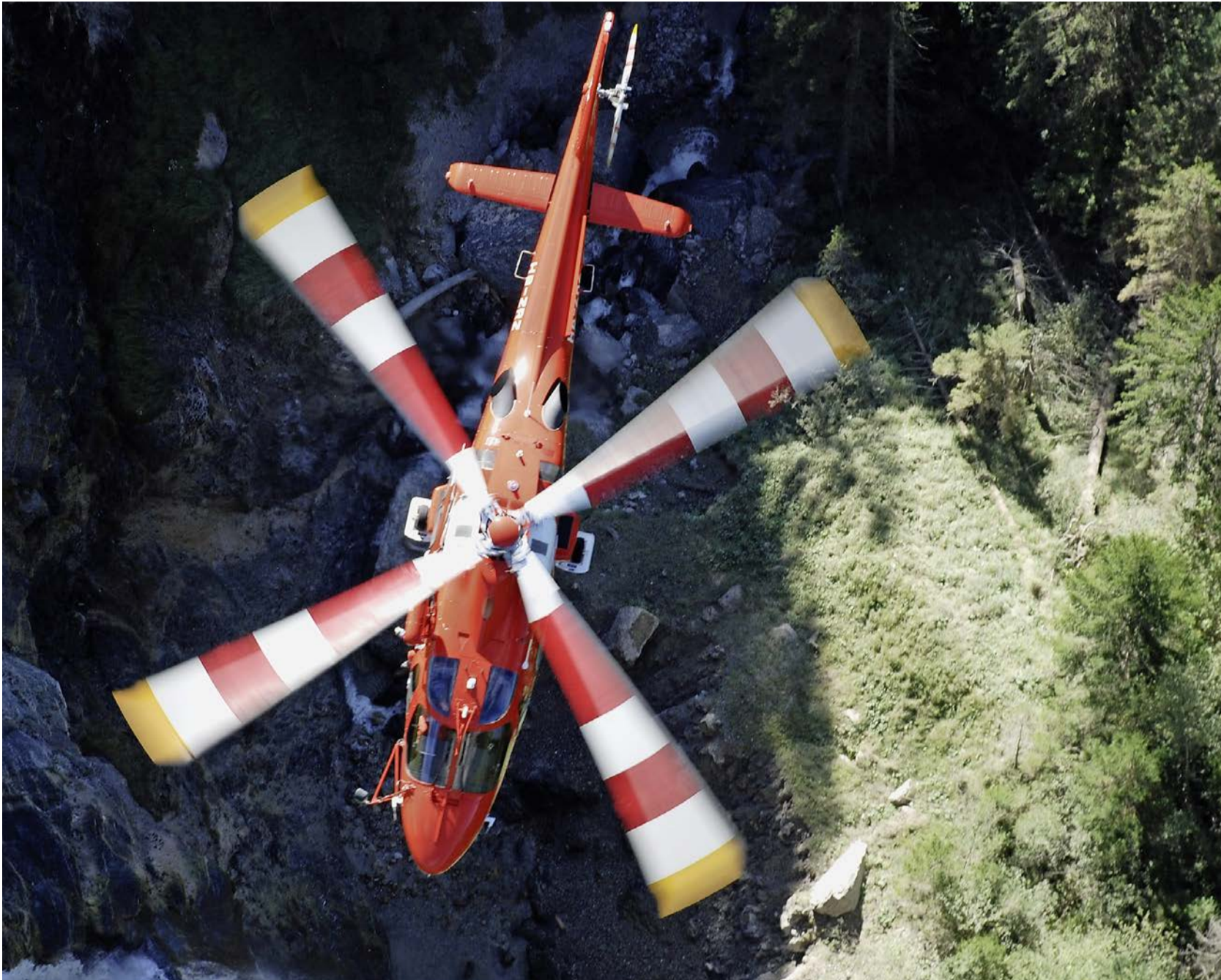
Rettingsflugwacht: Mit jährlich über 14 000 Einsätzen gehört sie zur medizinischen Grundversorgung der Schweiz

Profitorientierte Unternehmen werden oft negativ bewertet